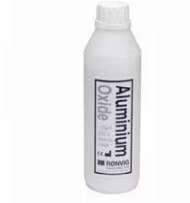
900 g Aluminiumoxid-Pulver 50 µm. Art.-Nr. 1906