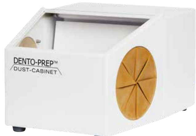
DENTO-PREP™ DUST-CABINET Art. No. 1905

Die Herstellergarantie beträgt 2 Jahre auf Material und Verarbeitung.